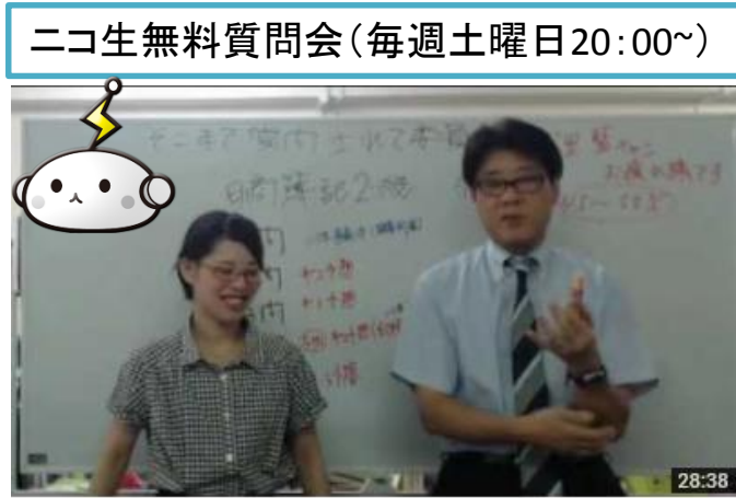
ニコ生無料質問会(毎週土曜日20:00~)