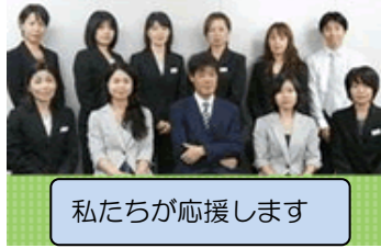
私たちが応援します