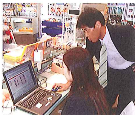
大阪：ケースメソッド社の指導風景

日常の入力方法や出力結果はもちろん、分析集計資料にも影響があります。まずはお客さまの現状をお聞きすることにより最適な初期設定・環境設定方法を決め、実施しマスターの登録方法をご指導します。