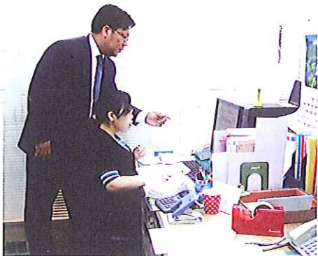
東京：スリーエスフォーラム社の指導風景

「ご使用中の弥生製品をさらに使いこなしたい」「他の弥生製品を追加購入する」「弥生ネットワーク製品を導入する」といったお客さまは、製品に合わせてこの「弥生塾」による指導もご検討ください。